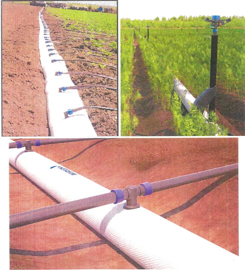
Şekil 1. Flexnet boruların arazide kullanım şekilleri

NETAFİM Sulama Sistemleri Sanayi ve Ticaret Ltd. Şti. yapımı Flexnet HP 6" – 163 mm Taşıyıcı Borular , geri dönüşüm yapılabilen PE (Polietilen) malzemeden üretilmiştir. Taşıyıcı ve dağıtım borusu olarak kullanılmaktadır. Tüm rulo uzunluğunda belirli aralıklarla üzerine sabitlenmiş 1/2" çapında çıkış konnektörleri yardımıyla damla sulama lateralleri ve yağmurlama başlıkları bağlanabilmektedir (Şekil 1).